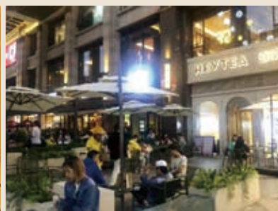
考慮北京天氣的情況，戶外區域設有保溫帳篷，可一秒切換敞開或遮蔽