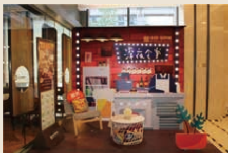
引入「深夜食堂」概念，創造獨一無二的晚間餐飲體驗