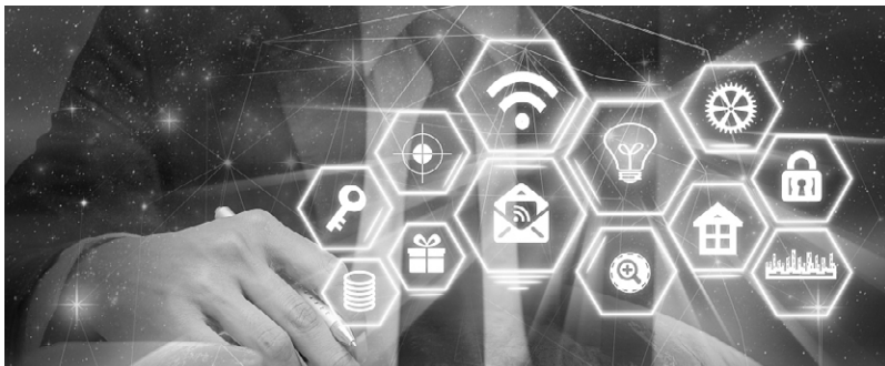
地产经营三大核心要素